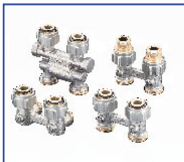
Ventilradiator tilslutning "Multiflex"